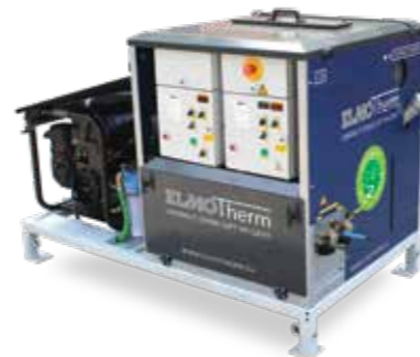
C30 COMPACT Doppelbrenner auf Wechselbrücke

160 x 127 x 110 cm 380 kg bis zu 1000 m 2 /h