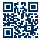
ELMOTherm®-Verfahren im Video

Mit dem ELMOTherm®-Verfahren sparen Sie Personal- und Betriebskosten, reduzieren Anwendungszyklen und CO 2 -Ausstoß und sparen bares Geld – mit jedem Einsatz!