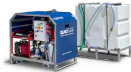
C15 COMPACT Einzelbrenner auf Wechselbrücke

160 x 127 x 110 cm 380 kg bis zu 650 m 2 /h